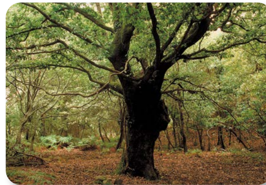
Los quejigos, de la misma familia que el alcornoque y la encina, eran aprovechados, por su dura y calorífica madera, para la construcción y el carboneo. Su fruto, que no debemos confundir con las agallas provocadas por la picadura de un insecto, es la bellota, que alimentaba también al ganado en montanera.

La falda del Picacho es serpenteada por algunos arroyuelos que han permitido que veamos, de nuevo, una vegetación parecida a la de la garganta de Puerto Oscuro e, incluso, con algún bello ejemplar de rododendro, reconocible por sus hojas de un color verde intenso y forma de elipse.