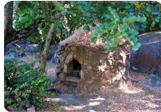
Eran muchos los molinos existentes en estas sierras que proporcionaban la harina para el pan necesario de cada día, que era cocido en hornos como éste, en teleras (piezas) de dos o tres kilos que los trabajadores consumían durante varios días.

Cerca de la laguna pasaremos junto a un antiguo horno de pan [3], para escuchar después el sonido del agua que anuncia nuestra llegada a la Garganta de Puerto Oscuro, nacimiento del río Barbate. En él nos encontramos un precioso bosque de ribera formado fundamentalmente por alisos, junto con algún que otro quejigo y almez.